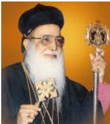
പ. ബസേലിയോസ് മാർത്തോമ്മാ മാത്യൂസ് ദിതീയൻ

പരിശുദ്ധ ബസേലിയോസ് മാർത്തോമ്മാ മാത്യൂസ് ദിതീയൻ ബാവാ സ്ഥാനത്യാഗം ചെയ്യുന്ന മൂന്നാം പൗരസ്ത്യ കാതോലിക്കയാണ്. പരിശുദ്ധ ബസേലിയോസ് ഔഗേൻ ബാവാ, പ. ബസേലിയോസ് മാർത്തോമ്മാ മാത്യൂസ് പ്രഥമൻ ബാവാ എന്നിവരാണ് ഇതിനുമുമ്പ് സ്ഥാനത്യാഗം ചെയ്തവർ.